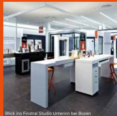
Blick ins Finstral Studio Unterinn bei Bozen

T +39 0471 296845 vintl@finstral.com www.finstral.com/vintl